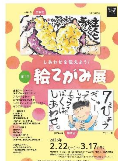
13 展覧会 チラシ