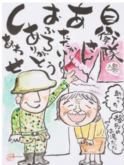
6 一般の部 優秀賞④ (宮永輝彦・富山県・60歳)