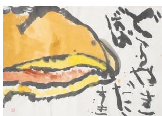
12 子どもの部 優秀賞⑤ (嶋晃之介・富山県・5歳)