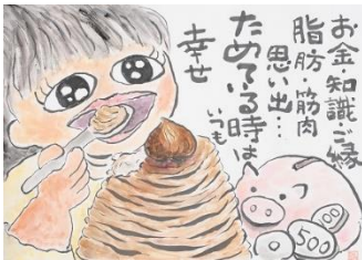
3 一般の部 優秀賞① (池田弘美・神奈川県・53歳)