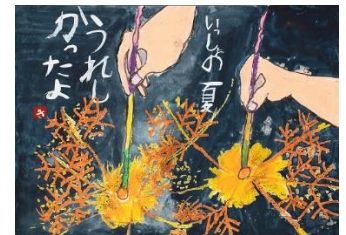
8 子どもの部 優秀賞① (小野喜路・富山県・7歳)