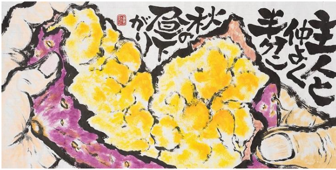
1 一般の部 知事賞 (小川美津子・佐賀県・61歳)