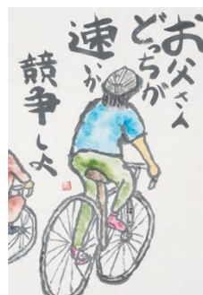
10 子どもの部 優秀賞③ (栗虫玲羽・富山県・13歳)