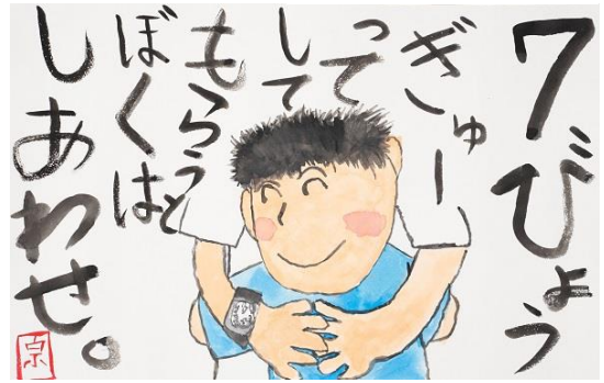
2 子どもの部 知事賞 (浦部宗福・埼玉県・7歳)