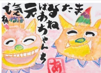
9 子どもの部 優秀賞② (片口藍里・富山県・7歳)