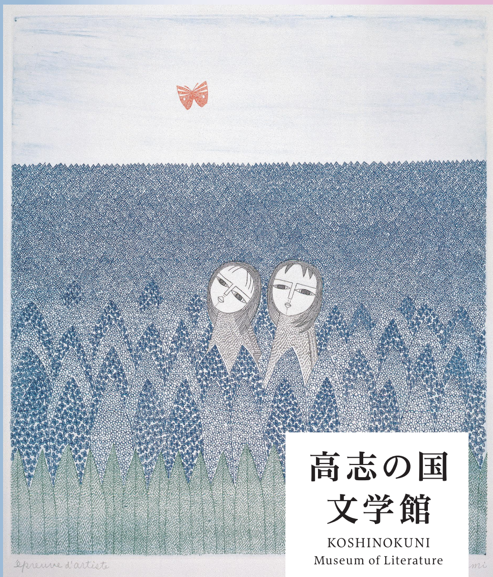
《2人の少女と蝶》1979年 エッチング、サンドペーパー 32.0×28.3cm ミュゼ浜口陽三・ヤマサコレクション蔵

高志の国 文学館 KOSHINOKUNI Museum of Literature