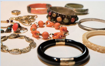
生前に蒐集したアクセサリー (ミュゼ浜口陽三・ヤマサコレクション蔵)

南桂子(1911-2004)は、現在の富山県高岡市に生まれ、県立高岡高等女学校では絵画制作や詩作に親しむ多感な少女時代を過ごしました。戦後まもなく上京し、銅版画と出会った南は、パリやサンフランシスコなど海外で活躍し、森の中の城、塔、少女や小鳥などをモチーフに、繊細で詩情あふれる銅版画作品を残しました。