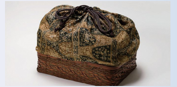
手書きの原稿が詰められていた巾着箱 (ミュゼ浜口陽三・ヤマサコレクション蔵)

没後20年を機に開催する本展では、銅版画作品と自作の童話や詩、詩人たちのことばをとおして、南桂子の世界を旅します。