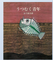
谷川俊太郎『うつむく青年』 山梨シルクセンター出版部1971年 (装幀/装画・南桂子)