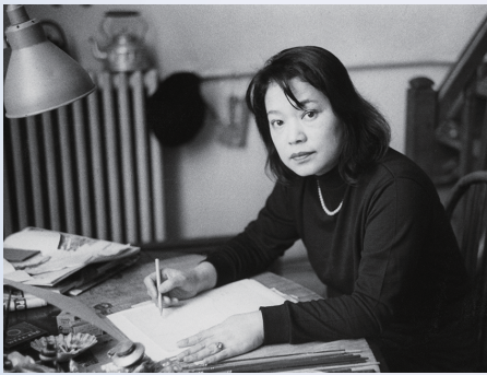
南桂子 1950年代パリのアトリエにて (ミュゼ浜口陽三・ヤマサコレクション蔵)