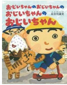
『おじいちゃんのおじいちゃんのおじいちゃん』 BL出版/2000年

日時/7月27日(土) 13:00開場 14:00開演 会場/富山県教育文化会館ホール 料金/入場料1,500円 高志の国文学館友の会会員1,000円 共催/富山県文化振興財団 富山県教育文化会館 販売/アーツナビ(6月8日(土)から)