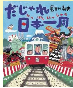
『だじゃれ日本一周』 理論社/2009年