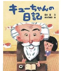
『キューちゃんの日記』 室井滋・作/北日本新聞社/2023年