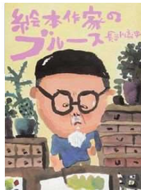
『絵本作家のブルース』 読書サポート/2019年