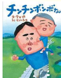
『チンチンボンボさん』 室井滋・作/絵本館/2015年