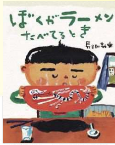
『ぼくがラーメンたべてるとき』 教育画劇/2007年