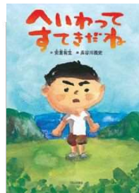
『へいわってすてきだね』 安里有生・詩/ブロンズ新社/2014年