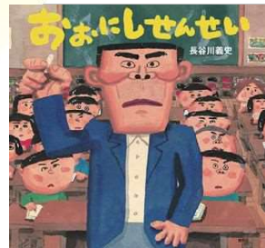
『おおにしせんせい』 講談社/2019年