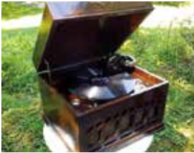
愛用の蓄音機 (軽井沢高原文庫蔵)