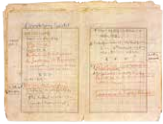
「ブルスト」ノオト (堀辰雄文学記念館蔵)