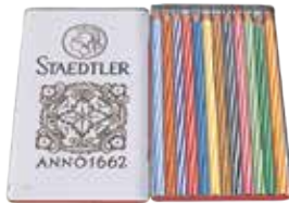
愛用のドイツ製色鉛筆 (堀辰雄文学記念館蔵)