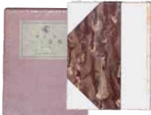
「風立ちぬ」 (野田書房、1938年刊) 当館蔵