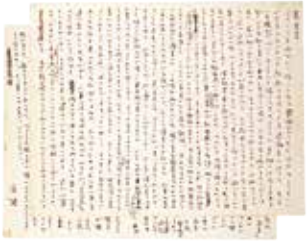
「美しい村」ノオト (堀辰雄文学記念館蔵)