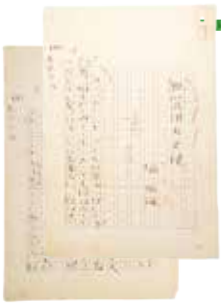
「不器用な天使」原稿 (軽井沢高原文庫蔵)

本展では、堀と軽井沢との関わりをたどりつつ、清新で詩心にあふれる堀の作風確立の過程と作品世界を、原稿、書簡、蔵書などの貴重な資料で紹介しあわせて、片山廣子による芥川龍之介宛書簡(当館蔵)を特別公開し、堀と交流の深かった軽井沢ゆかりの文学者たちを紹介しあわせます。