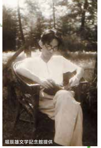
堀辰雄文学記念館提供