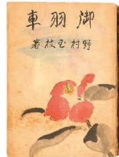
野村玉枝『御羽車』1942年 (高志の国文学館蔵)