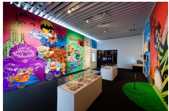
5 ポップゾーン イメージ