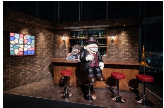
3 エントランスゾーン (Bar 魔の巣展示)