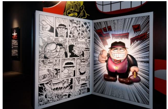
7 笑わせえるすまんゾーン ©藤子スタジオ