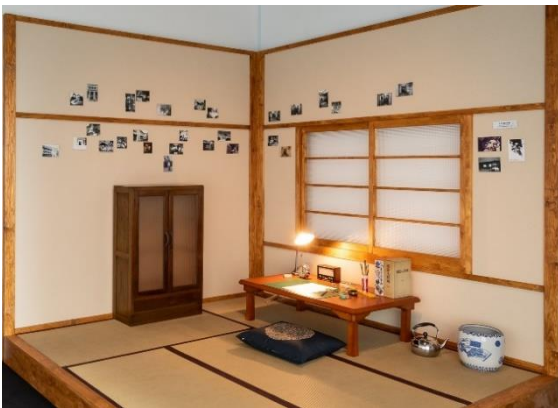
4 トキワ荘 再現展示 ©藤子スタジオ