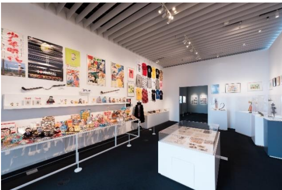
8 変コレクションゾーン イメージ ©藤子スタジオ