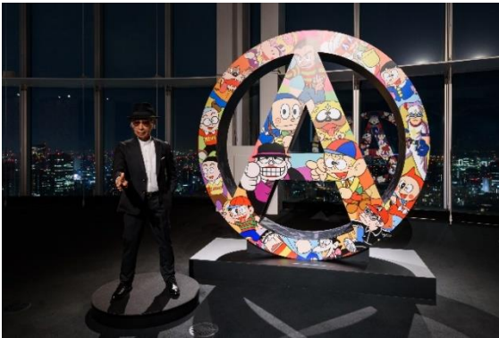
2 エントランスゾーン (Aマークオブジェ・藤子A氏等身大人形)